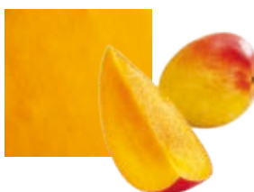
МАНГО, 100 %, ОРГАНИЧЕСКИЙ Поставщик: Индия Единица для продажи: 1 ведро × 10 кг