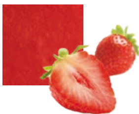
КЛУБНИКА, 100 %, ОРГАНИЧЕСКАЯ Поставщик: Польша, Марокко Единица для продажи: 1 ведро × 10 кг