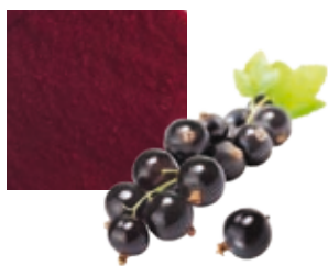
ЧЕРНАЯ СМОРОДИНА, 100 %, ОРГАНИЧЕСКАЯ Поставщик: Польша Единица для продажи: 1 ведро × 10 кг