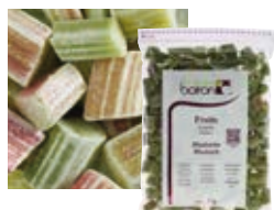
РЕВЕНЬ КУСОЧКАМИ Поставщик: Польша Единица для продажи: 5 картонных упаковок × 1 кг