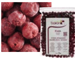
ЦЕЛЬНАЯ ВИШНЯ, ОЧИЩЕННАЯ И БЕЗ КОСТОЧЕК Поставщик: Сербия Единица для продажи: 5 картонных упаковок × 1 кг 1 картонная упаковка × 10 кг