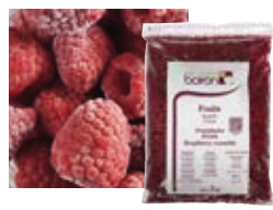
ДРОБЛЕНАЯ МАЛИНА «ВИЛЛАМЕТТЕ» Поставщик: Сербия Единица для продажи: 5 картонных упаковок × 1 кг 1 картонная упаковка × 15 кг