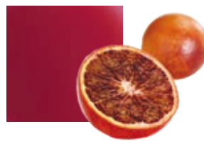
СИЦИЛИЙСКИЙ КРАСНЫЙ АПЕЛЬСИН, НА 100 % из фруктов категории IGP Поставщик: Италия Единица для продажи: 3 картонных упаковки × 1 кг