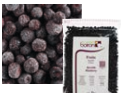
ЦЕЛЬНАЯ ЧЕРНИКА Поставщик: Польша Единица для продажи: 5 картонных упаковок × 1 кг