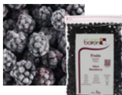
ЦЕЛЬНАЯ ЕЖЕВИКА Поставщик: Чили Единица для продажи: 5 картонных упаковок × 1 кг