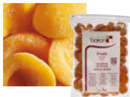
АБРИКОСЫ БЕЗ КОСТОЧКИ Поставщик: Марокко Единица для продажи: 5 картонных упаковок × 1 кг