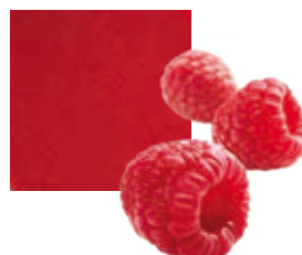
МАЛИНА, 100 %, ОРГАНИЧЕСКАЯ Поставщик: Сербия Единица для продажи: 1 ведро × 10 кг