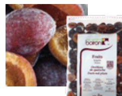
СЛИВА «КЕТШ», ОЧИЩЕННАЯ ОТ КОСТОЧЕК ВРУЧНУЮ Поставщик: Сербия Единица для продажи: 5 картонных упаковок × 1 кг

В некоторых странах доступны не все вкусы.