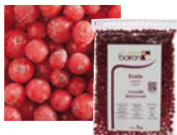
ОТДЕЛЕННАЯ ОТ ВЕТОЧЕК СМОРОДИНА Поставщик: Польша Единица для продажи: 5 картонных упаковок × 1 кг