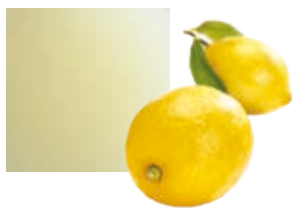
СИРАКУЗСКИЙ ЛИМОН, НА 100 % из фруктов категории IGP Поставщик: Италия Единица для продажи: 3 картонных упаковки × 1 кг

Маркировка IGP накладывает на производителей обязательства по соблюдению очень строгих технических требований, гарантирующих высокое качество и свежесть фруктов, а также строгую систему отслеживания. Поэтому фрукты со знаком IGP являются сокровищами наших земель. Для всех специалистов в области гастрономии они являются гарантией качества.