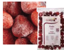
КЛУБНИКА Поставщик: Польша Единица для продажи: 5 картонных упаковок × 1 кг 1 картонная упаковка × 10 кг