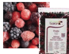
СМЕСЬ КРАСНЫХ ЯГОД Поставщик: Польша Единица для продажи: 5 картонных упаковок × 1 кг