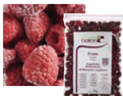
ЦЕЛЬНАЯ МАЛИНА МЕЙКЕР Поставщик: Сербия Единица для продажи: 5 картонных упаковок × 1 кг