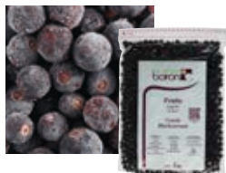
ЧЕРНАЯ СМОРОДИНА Поставщик: Франция Единица для продажи: 5 картонных упаковок × 1 кг