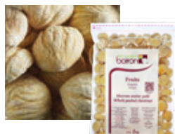
ЦЕЛЬНЫЕ КАШТАНЫ, ОЧИЩЕННЫЕ И СОРТИРОВАННЫЕ Поставщик: Португалия Единица для продажи: 5 картонных упаковок × 1 кг