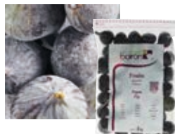
ЦЕЛЬНЫЙ ИНЖИР Поставщик: Франция Единица для продажи: 5 картонных упаковок × 1 кг