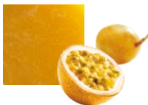
МАРАКУЙЯ, 100 %, ОРГАНИЧЕСКАЯ Поставщик: Перу Единица для продажи: 1 ведро × 10 кг