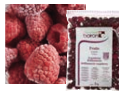
ЦЕЛЬНАЯ МАЛИНА «ВИЛЛАМЕТТЕ» Поставщик: Сербия Единица для продажи: 5 картонных упаковок × 1 кг 4 картонных упаковки × 2,5 кг