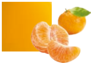
КОРСИКАНСКИЙ КЛЕМЕНТИН, НА 100 % из фруктов категории IGP Поставщик: Франция Единица для продажи: 3 картонных упаковки × 1 кг