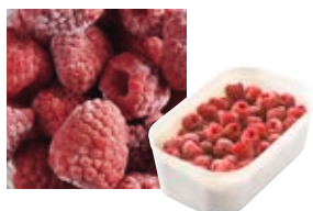
ЦЕЛЬНАЯ И СОРТИРОВАННАЯ МАЛИНА МЕЙКЕР Поставщик: Босния Единица для продажи: 12 картонных упаковок × контейнер 500 г